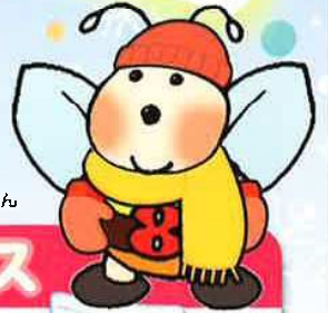
エコハッチちゃん