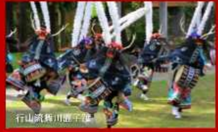
行山流舞川面千舞