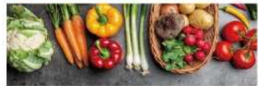
画像は秀吉の店舗で提供している料理イメージです。