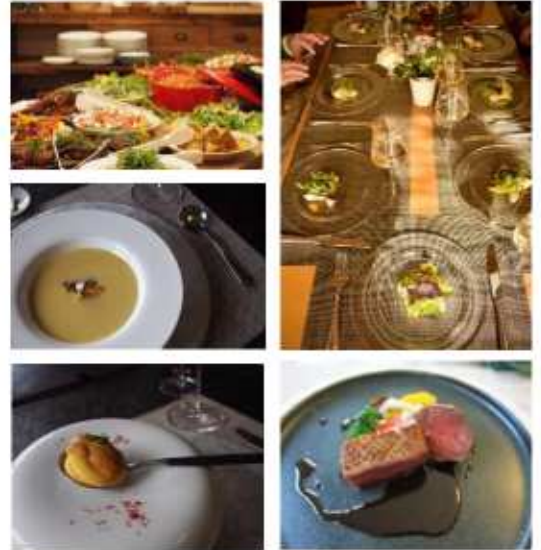
画像はシェフ作品のイメージです。