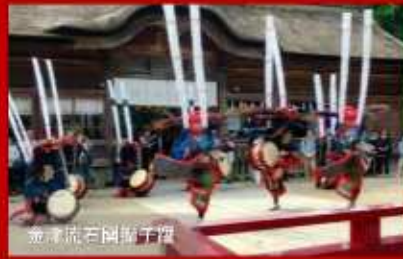
金津流石岡舞千舞